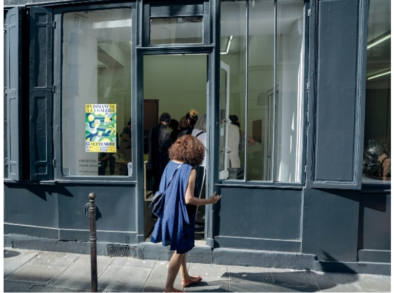
Façade de la galerie Florence Loewy lors de l'édition 2019 d'« Un Dimanche à la Galerie ».